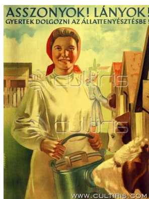
1. ábra Munkásnő 2

Kendős, mosolygós munkába álló nőkel voltak tele a filmhíradók, a plakátok. (Bene 2007: 33)