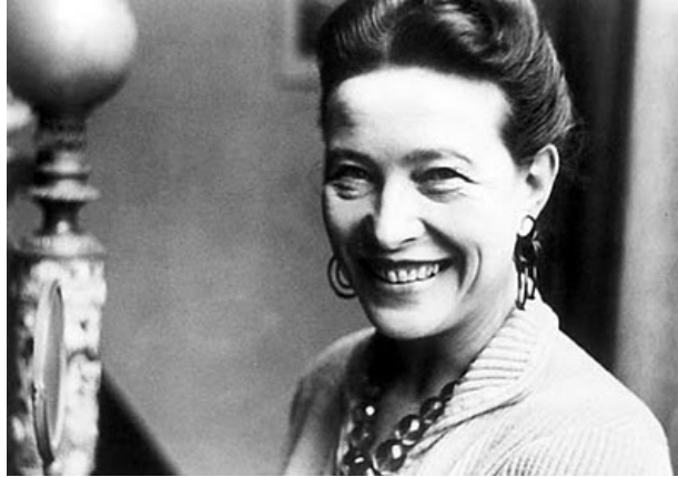
5. ábra Simone de Beauvoir 4